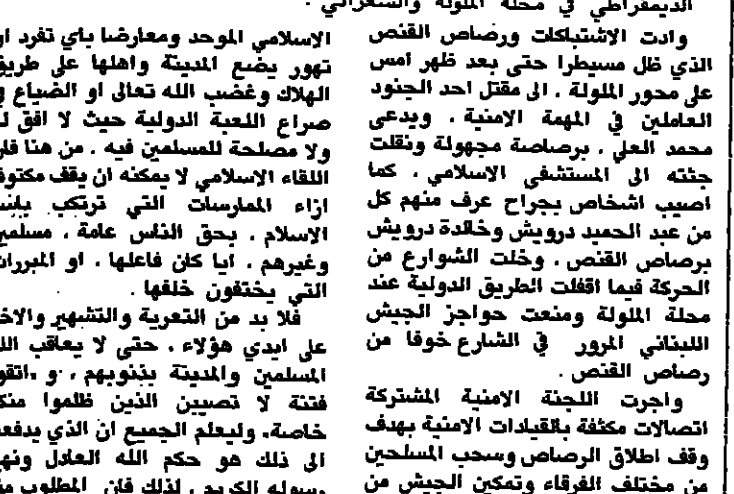
سيرة نوب من رصاص القصف في المولدة